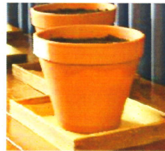
たねまき、たねまき