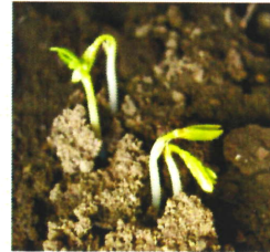
芽がでた 芽がでた