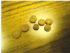
レンズマメってこんな豆。